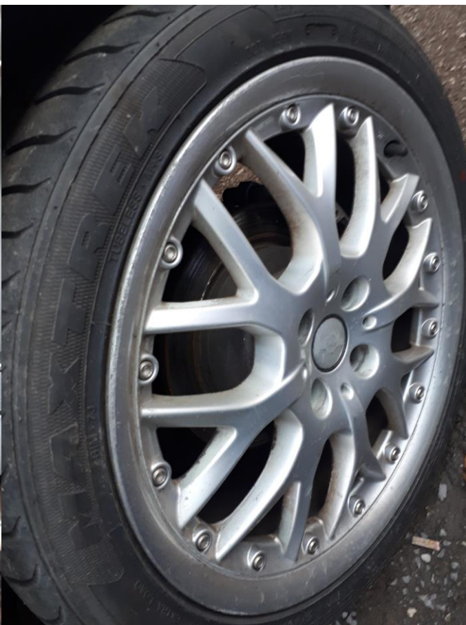
Износени и ръждясали задни дискове: