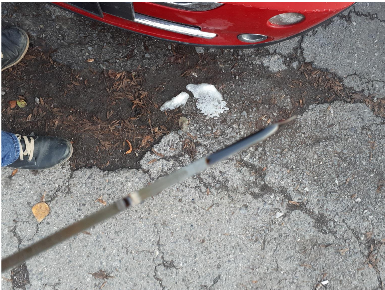
Теч на масло от гарнитура на капак клапани: